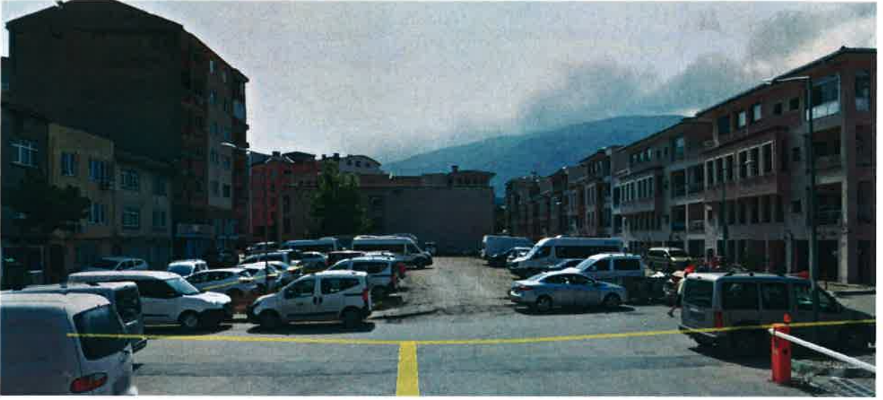
Resim 3. Sokak Görüntüsü