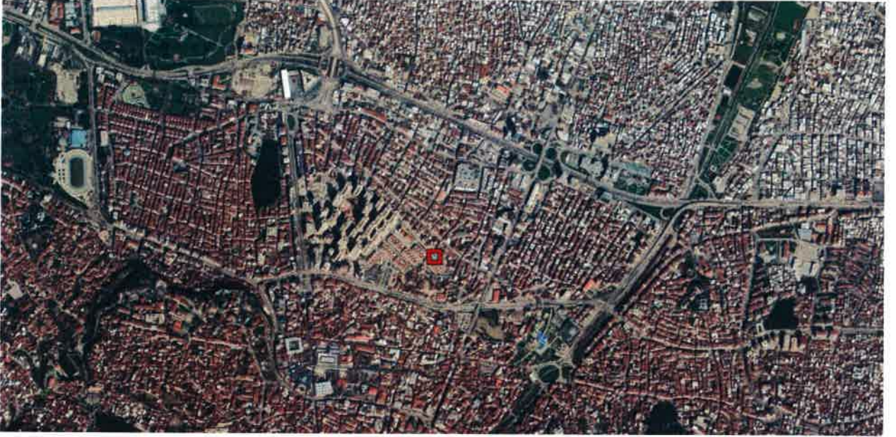
Resim 1. Bölgedeki Konumu

Plan değişikliğine konu, 1309 m 2 büyüklüğündeki Osmangazi İlçesi, Tayakadın Mahallesi, 7303 ada 8 parsel, Ankara Yolunun 600 m. güneyinde, Haşim İşcan Caddesinin 200 m. kuzeyinde ve İnönü Caddesinin 250 m. doğusunda yer almaktadır.