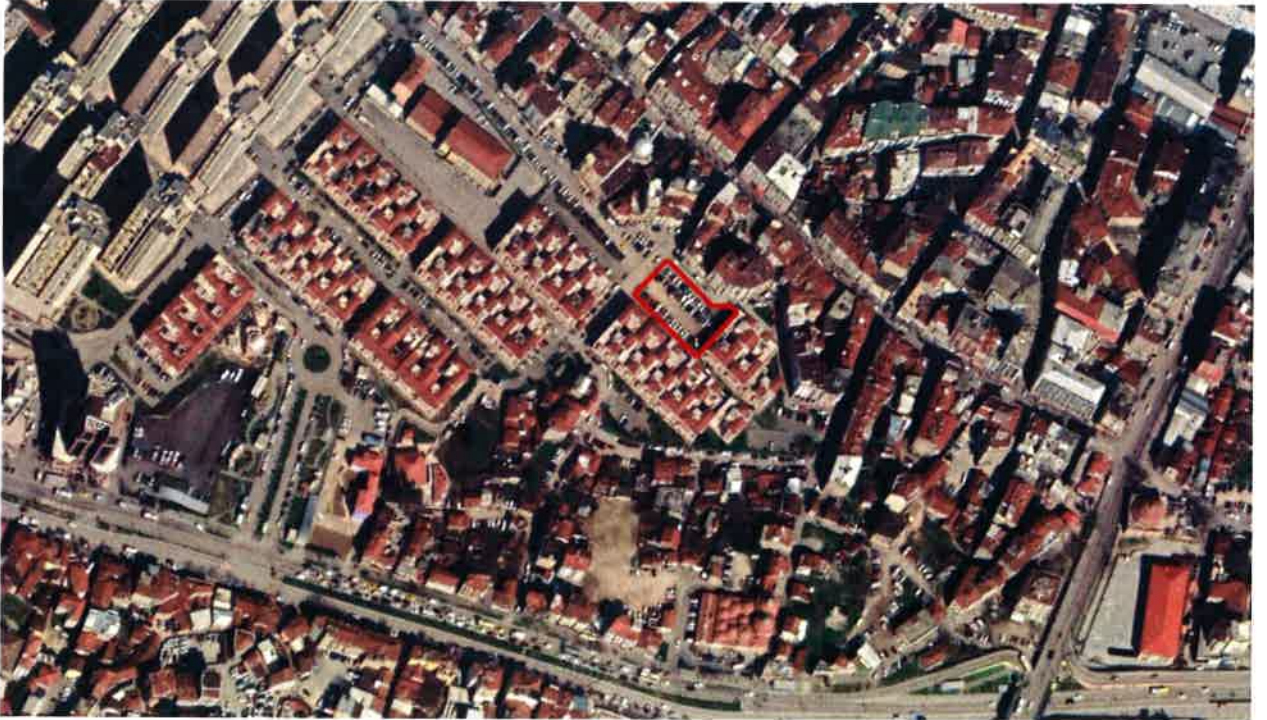
Resim 2. Mahalledeki Konumu